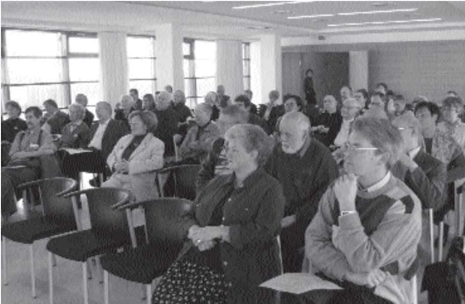
Blick ins Auditorium am zweiten Tag (Penthouse Wallstr. 65).

Ein positiver Bedeutungshorizont der Sterbehilfe scheint am ehesten möglich, wenn er vom Begriff der Tötung abgegrenzt wird. Schließlich sollten wir uns und anderen das kritische Nachdenken über sensible ethische Fragen nicht ersparen, und gerade damit BündnispartnerInnen überzeugen und gewinnen – in der konkreten Praxis, im medizinethischen Kontext und vielleicht auch einmal in der Politik.